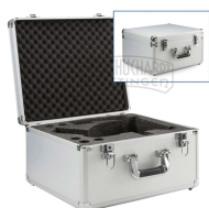
Aluminium Transportkoffer Bestellnummer 421012